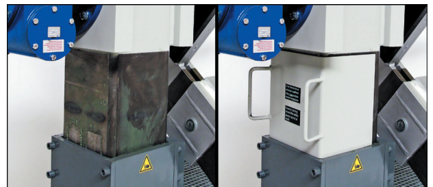
Abbildung mit Sicherungsblech / Picture with safety plate

WW-PS-2500 Podest-seitlich / Podium side (500 mm x 1500 mm)